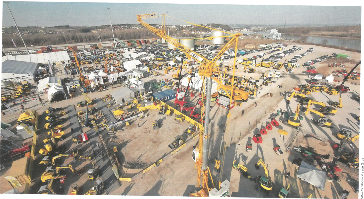
Mawev Show/Messe Graz