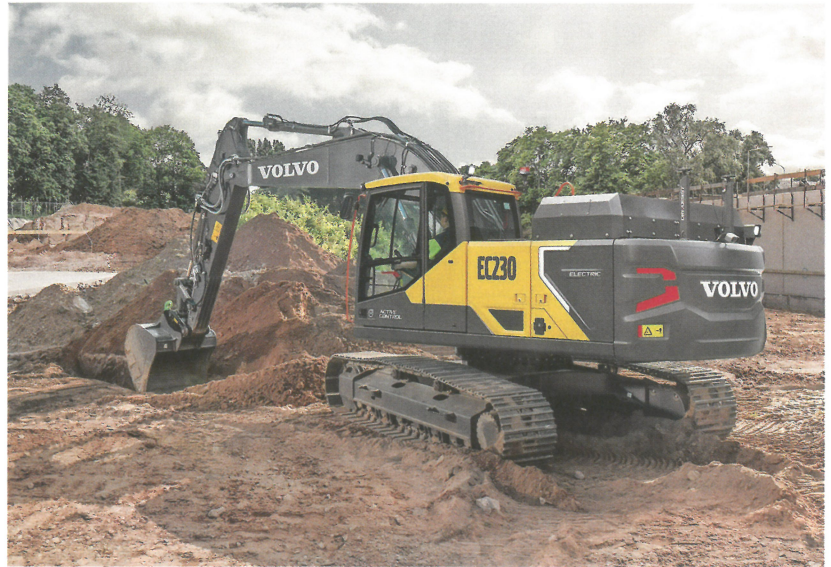
Der Volvo EC230 Electric feiert seine Österreichpremiere auf der Mawev Show. Dieser 23-Tonnen-Elektro-Kettenbagger bietet die gleiche Leistung wie ein vergleichbares Diesel-Modell, ist dabei allerdings emissionsfrei, geräusch- und vibrationsarm.