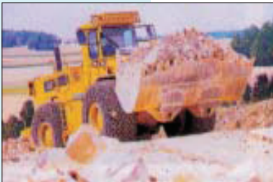
Fahrstraßen müssen ausreichend breit, mit möglichst geringem Gefälle und auf tragfähigem Untergrund angelegt sein

Abstand von der Absturzkante festzulegen. Bei Befahren von aufgeschütteten Rampen ist darauf zu achten, dass Erdbaumaschinen nicht aus der verdichteten Fahrspur geraten. In der Nähe von Baugruben, Schächten und Böschungsrändern sind Erdbaumaschinen gegen Abrollen oder Abrutschen z. B. durch Einlegen von Bremsen, Ausfahren zusätzlicher Abstützevorrichtungen, Verwendung von Anschlagsschwellen oder Vorlegeklötzen zu sichern.