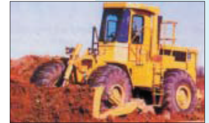
Überrollschutzaufbau bei einem Radlader mit Planiereinrichtung

Lader, Planiergeräte, Scraper, Grader, knickgelenkte Muldenkipper und Baggerlader, jeweils mit einer Motorleistung über 15 kW (nach ISO 9249), sind mit Überrollschutzaufbauten auszurüsten. Muldenkipper mit starrem Rahmen und einer Motorleistung über 30 kW müssen mit Überrollschutz versehen sein. Für die Gestaltung und Prüfung der ROPS gelten die Normen ÖNORM ISO 3164 und ÖNORM ISO 3471.