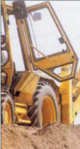
Der Fahrerplatz muss sicher erreichbar sein