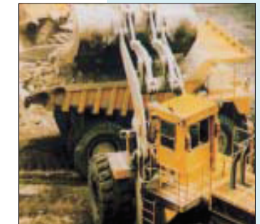
Der Maschinenführer darf die Arbeitseinrichtung über den Fahrer nur hinwegschwenken, wenn dieser durch ein Schutzdach gesichert ist