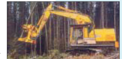
Schutzaufbauten gegen herabfallende Gegenstände

Lader, Planiermaschinen, Scraper, Baggerlader und Muldenkipper, jeweils mit einer Motorleistung über 15 kW (nach ISO 9249), müssen mit Schutzaufbauten gegen herabfallende Gegenstände ausgerüstet sein, wenn sie in Bereichen eingesetzt werden, in denen Gefahr durch herabfallende Gegenstände besteht.