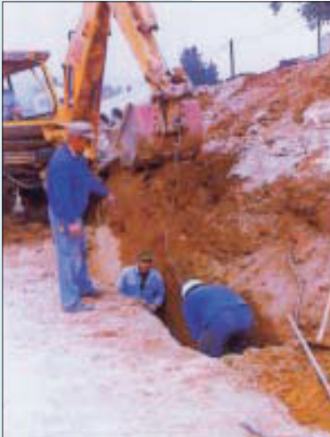
Der Maschinenführer hat darauf zu achten, dass er während des Betriebs keine Personen gefährdet

Der Maschinenführer hat darauf zu achten, dass sich während des Betriebes keine Personen im Gefahrenbereich seiner Maschine aufhalten. Er hat bei Gefahr für Personen Warnzeichen zu geben (z. B. Huptöne, Lichtsignale). Der Betrieb ist einzustellen, wenn Personen trotz Warnung den Gefahrenbereich nicht verlassen.