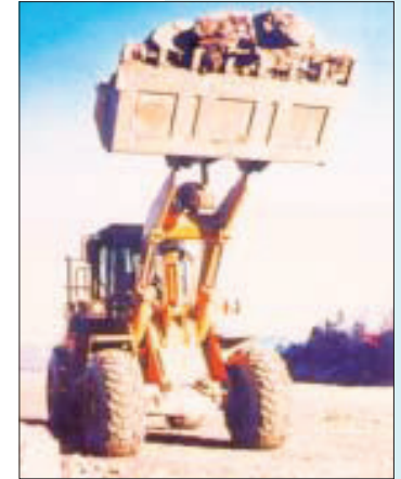
Fahrzeuge sind so zu beladen, dass sie während der Fahrt kein Material verlieren können

An ortsveränderlichen Kippstellen dürfen Erdbaumaschinen nur betrieben werden, wenn geeignete Maßnahmen zur Sicherung gegen Abflauen und Abstürzen, z. B. Anschläge, Anschüttungen, getroffen werden.