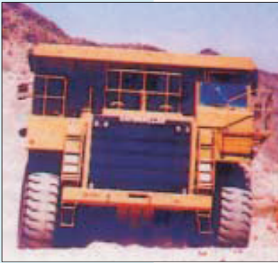
Die zulässige Belastung der Fahrzeuge darf nicht überschritten werden

Erdbaumaschinen müssen so betrieben und eingesetzt werden, dass ihre Standsicherheit gewährleistet ist. Die