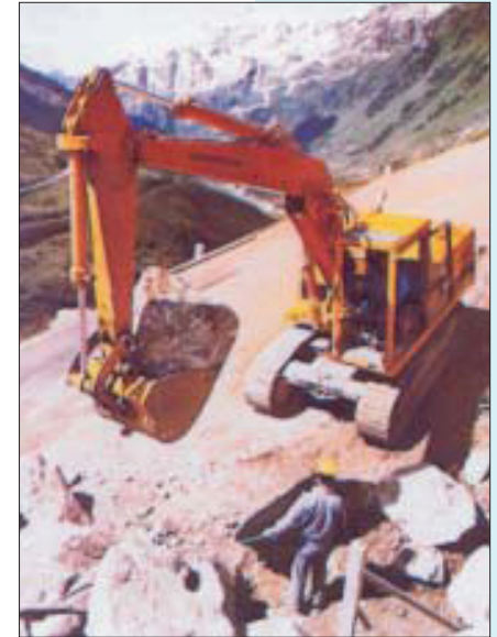
Der Aufenthalt im Gefahrenbereich ist verboten!

Ebenso müssen an knickgelenkten Erdbaumaschinen im Knickbereich gut sichtbar zusätzlich Schilder mit folgendem Wortlaut angebracht sein: „Der Aufenthalt im Knickbereich ist verboten!“ Wenn die Erdbaumaschine für den Einsatz in explosionsgefährlichen Bereichen vorgesehen ist, muss das deutlich an der Maschine gekennzeichnet sein.