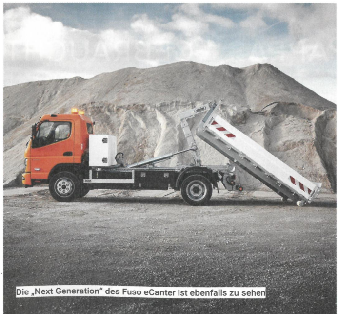
Die „Next Generation“ des Fuso eCanter ist ebenfalls zu sehen