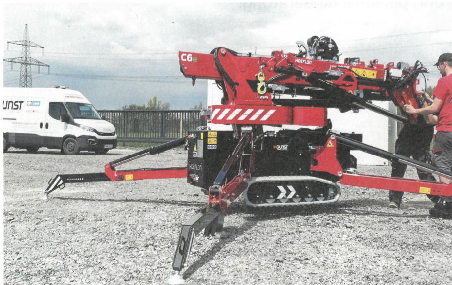
HOEFLON Mini-Hebekrane sind flexibel und rasch einsetzbar: ein Kranservice, das somit auch bei Ausfällen in der Baubranche für schnelle Hilfe sorgt

Platz finden. Zugeschnitten auf individuelle Anforderungen konzipiert und konstruiert DUNST auch Spezialauf- & -umbauten. Ihre Ansprechpartner für die Idee bis hin zum einsatzbereiten Fahrzeug samt Instandhaltung und Service freuen sich aufs persönliche Gespräch vor Ort! Im laufenden Betrieb punktet DUNST mit dem mobilen Kranservice – 24 Stunden am Tag und 365 Tage im Jahr erreichbar ist das Team schnell vor Ort, wenn Ersatzteile oder dringende Reparaturen gefragt sind. UNILOCK Kran-Schnellwechselsysteme, CORMACH Großkrane, TERBERG Mitnahmestapler und ein gut sortiertes Programm von Kranzubehör runden das Angebot von DUNST Hydraulik auf der MAWEV-Show ab. Alle Besucher sind herzlich eingeladen, sich über Neues und Bewährtes zu informieren und die kraftvollen Produkte aus dem DUNST-Portfolio live zu erleben. aü <<