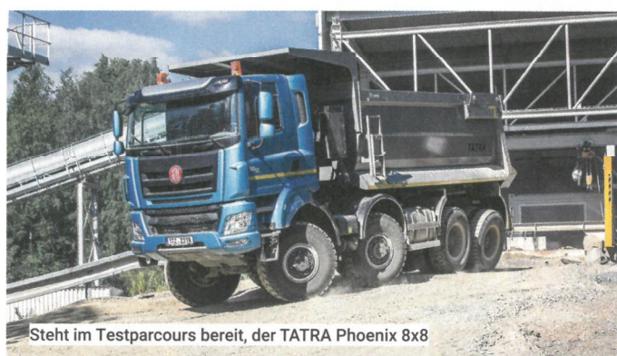
Steht im Testparcours bereit, der TATRA Phoenix 8x8