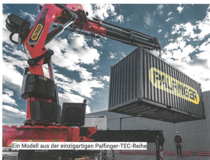
Ein Modell aus der einzigartigen Palfinger-TEC-Reihe