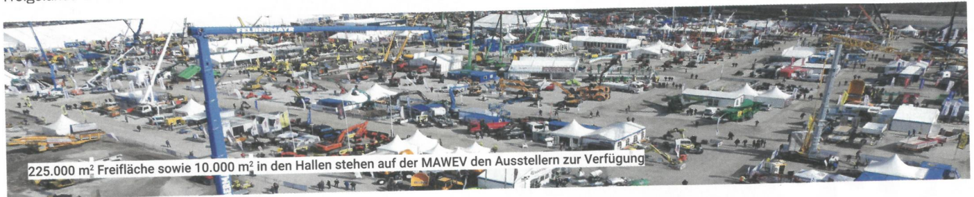
225.000 m 2 Freifläche sowie 10.000 m 2 in den Hallen stehen auf der MAWEV den Ausstellern zur Verfügung

Motto „Demonstration statt reiner Präsentation“ bleibt auch 2024 kein Stein auf dem anderen. Zahlreiche Baumaschinen, Baugeräte und Baufahrzeuge werden im realen Einsatz gezeigt und können live getestet werden. Ein besonderes Highlight bei der heurigen Show ist die LKW-Teststrecke am MAWEV-Gelände, auf dieser dreht sich alles um die gewichtigen Nutzfahrzeuge. kt