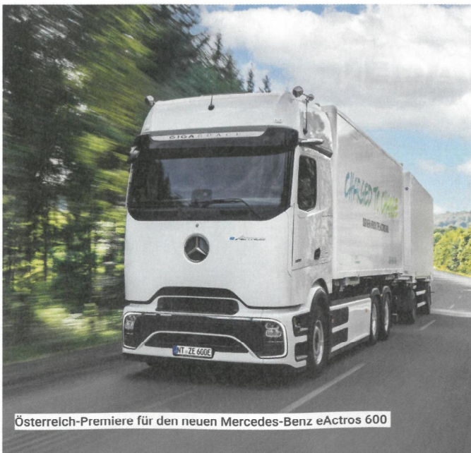
Österreich-Premiere für den neuen Mercedes-Benz eActros 600