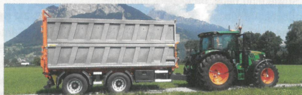
Tandem-3-Seiten-Kipper mit gelenkter zweiter Achse und Kipperbrücke aus Haxdox