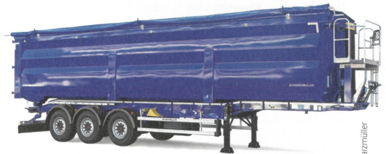
Die 3-Achs-Stahl-Kastenmulde für den Schrotttransport

einen Drehstangenverschluss verriegelt und betätigt wird. Zum sicheren Be- und Entladevorgang ist zusätzlich eine pneumatische Sicherungsverriegelung verbaut, welche seitlich am Auflieger betätigt wird. Eine Rollplane inklusive abnehm- bzw. umschwenkbaren Rohrquerverbindungen, LED-Beleuchtung, ein Stehpodest sowie eine erhöhte Kupplungshaltung runden dieses Fahrzeug ab. kt