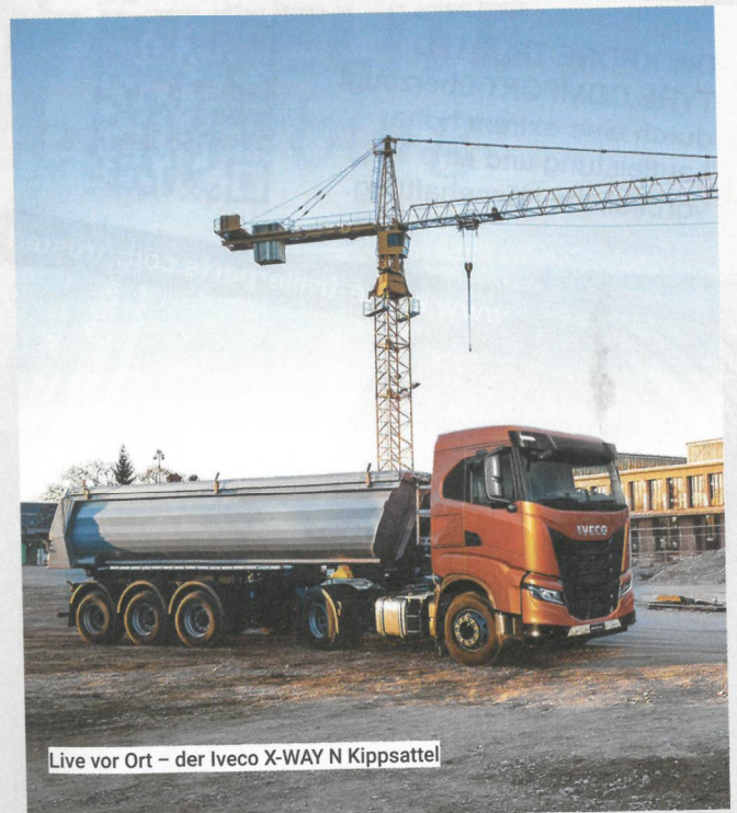
Live vor Ort – der Iveco X-WAY N Kippesattel

Anwendungen mit hohem Straßenanteil und leichter Geländemobilität und verbindet die Vorteile des Offroad-Spezialisten T-WAY mit der ultimativen Onroad-Leistung und der Kraftstoffeffizienz des S-WAY. Der Stralis X-WAY bietet mit seiner Flexibilität und niedrigem Eigengewicht die perfekte Antwort auf verschiedenste Anforderungen – vom leichten Kipper bis zum Betonmischer. Ebenfalls zu sehen ist der Daily, der mit starken Motoren bis zu 205 PS, einem hohen Drehmoment bis 480 Nm, Gesamt-